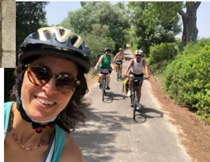
Cycling Tourism & Erasmus For Young Entrepreneurs