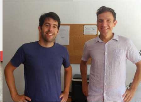
E Programme adds a business twist to Bruiaj – a leather story in Cluj