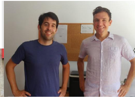
E Programme adds a business twist to Bruiaj – a leather story in Cluj