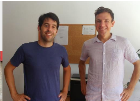
E Programme adds a business twist to Bruiaj – a leather story in Cluj