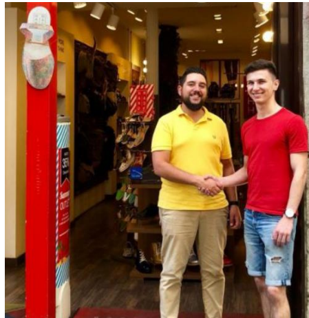
Cycling Tourism & Erasmus For Young Entrepreneurs